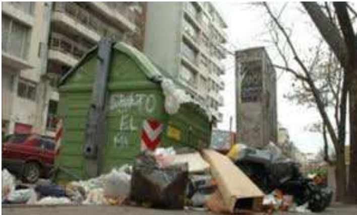
Arriba Pocitos, abajo el Centro. Dos empresas, una Intendencia y la misma realidad