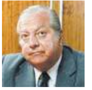
Enrique Tarigo Abogado Profesor de la Facultad de Derecho Vicepresidente de la República Director Fundador de OPINAR

¿Y a esta altura –contestará con otra pregunta el lector al tropezar con la interrogante del título- por qué razón esta duda o esta inquietud?