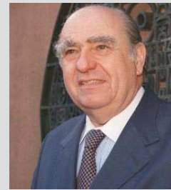
Julio María Sanguinetti Abogado., Periodista Presidente de la República Senador