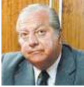
Enrique Tarigo Director Fundador de OPINAR Abogado. Catedrático de la Facultad de Derecho Vicepresidente de la República (1985/1990)