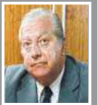
Enrique Tarigo Abogado Catedrático de la Facultad de Derecho Ex Vicepresidente de la República Director Fundador de OPINAR