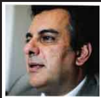
Francisco Centurion Arquitecto Ex Intendente Municipal de Río Negro