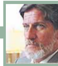
Luis Hierro López Vicepresidente de la República 2000/2005 Ex Senador y Ministro del Interior Periodista Fundador de OPINAR www.hierro.com.uy