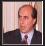
José AMORIN BATLLE Senador

Y la que no entiende todo esto es la gente. Es claro que este IRPF no es un impuesto equitativo, es un impuesto que hace tabla rasa: tanto gana, tanto se le cobra. Eso está absolutamente discutido, no importa si tiene 18 hijos, si heredó una fortuna, acá le cobran igual, no es equitativo.