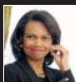
Condoleezza RICE Ex Secretaria de Estado de los EEUU

Rivera es un ejemplo para todos los colorados, quienes debemos y vamos a llegar a tener, los gobiernos departamentales en manos Batllistas.