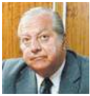
Enrique TARIGO Abogado - Vicepresidente de la República 1985/1990 Catedrático de la Facultad de Derecho Director Fundador de OPINAR