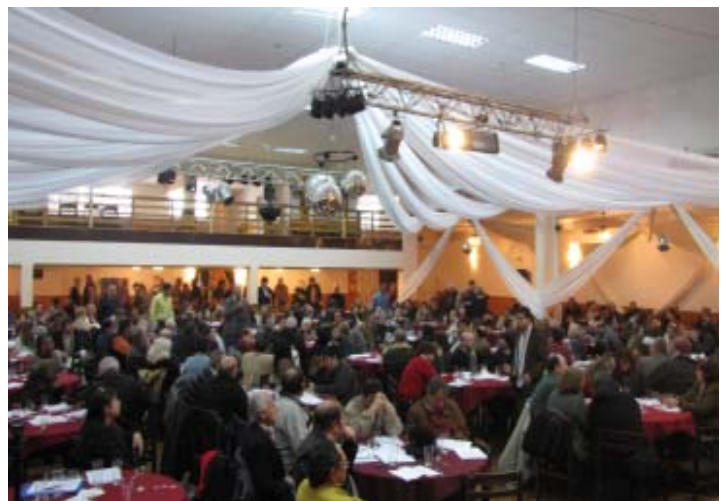
Hubo diálogo, crítica y reivindicación al batllismo