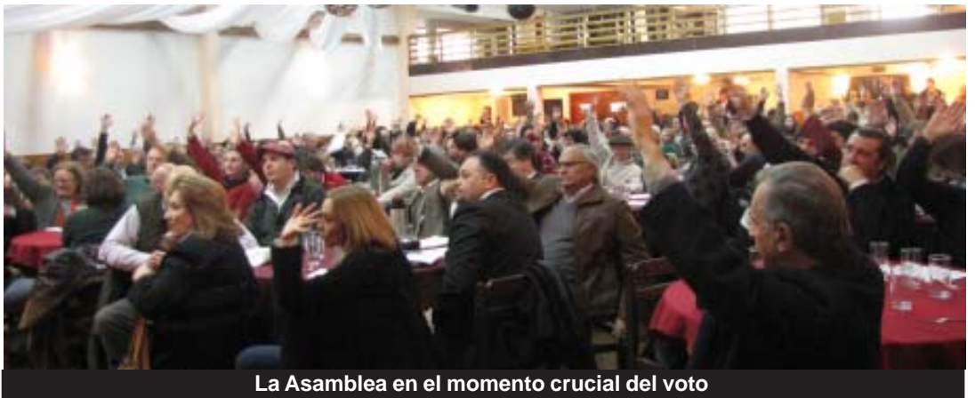
La Asamblea en el momento crucial del voto