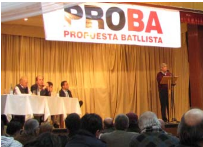
Hubo participación de dirigentes de todo el país