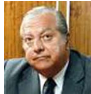
Enrique Tarigo Abogado Profesor de la Facultad de Derecho Vicepresidente de la República Director Fundador de OPINAR

La siguiente es una entrevista realizada al Dr. Enrique Tarigo por la revista digital La Onda, en diciembre del año 2000. Tarigo descubre en esa oportunidad aspectos nuevos del plebiscito del 30 de Noviembre de 1980, en que los uruguayos se negaron a institucionalizar a la dictadura cívico militar. El ex vicepresidente de la República relató una serie de anécdotas de aquellos días, desconocidas para a las nuevas generaciones, y reflexionó sobre el significado del triunfo del NO que sorprendió al mundo.