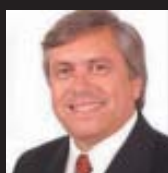
Tabaré VIERA DUARTE

Ex Intendente de Rivera (2000/2005 - 2005/2009) Ex Diputado, Presidente de ANTEL y Director de OSE. Actual Senador de la República Integrante del Consejo Editorial de OPINAR