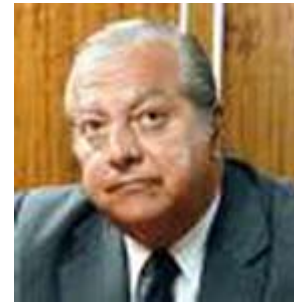
Enrique Tarigo Abogado Profesor de la Facultad de Derecho Vicepresidente de la República Director Fundador de OPINAR

DECÁLOGO DEL JOVEN BATLLISTA - por el Dr. Enrique Tarigo Un grupo de jóvenes amigos me ha pedido, insistentemente, la redacción de un «Decálogo del Joven Batllista», que he demorado más de lo conveniente. Me ha parecido desde el comienzo y he cedido sólo ante la perseverancia de estos jóvenes, que esta tarea no me competía a mí sino a alguno de los «grandes viejos» con que el Partido felizmente cuenta y que por la dedicación de toda su vida a la actividad política, no sólo están en mejores condiciones para hacerlo sino que, además, poseen la autoridad moral e intelectual para ello. He debido ceder ante la insistencia y, para justificar ante mí mismo ese renunciamiento, he optado por la adopción de un método que en buena medida me exonera de la sospecha de toda pretensión vanidosa. Y ese método no ha sido otro que el de adoptar, para la actividad política, los mandamientos que aquel Maestro de juventudes que fue Eduardo J. Couture escribiera para los abogados, para los jóvenes abogados principalmente.