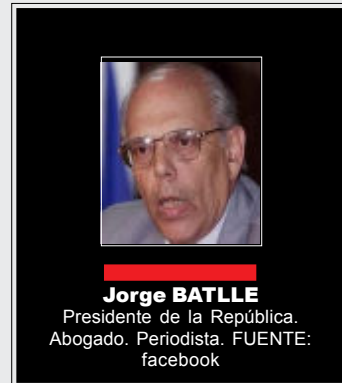
Jorge BATLLE Presidente de la República. Abogado. Periodista. FUENTE: facebook

En este asunto, de tanta envergadura e importancia no puede participar el ANCAP. Es otro el nivel de lo que estamos tratando.