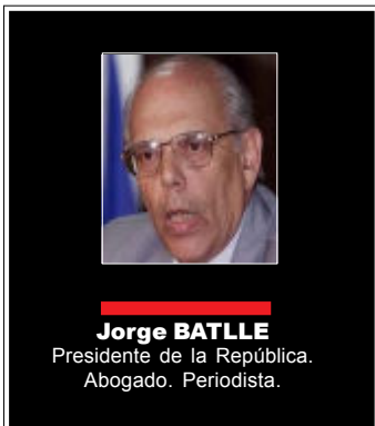
Jorge BATLLE Presidente de la República. Abogado. Periodista.

¡Mucho peor! La inseguridad sin límites. A mi consuegro, en su comercio de Colón, lo robaron varias veces. En el segundo robo le pusieron la pistola en la cabeza y le dispararon 2 tiros. Por suerte la pistola falló, ó era mala ó no tenía balas. Ayer nos encontramos en familia, como si hubiera vuelto a nacer. Su negocio está cerca de la Comisaría, pero no se puede hablar a la Comisaría, hay que llamar al 911, que cuando llega, si llega, todo ya pasó. La situación