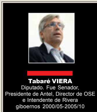
Tabaré VIERA Diputado. Fue Senador, Presidente de Antel, Director de OSE e Intendente de Rivera gobiernos 2000/05-2005/10

Tal vez, ahora sí deberemos retirarnos de un diálogo que solo pretende avanzar en algunas leyes que bien se pueden consensuar en el Parlamento, ámbito natural para esos menesteres y no quedarnos abrazados al fracaso del Frente Amplio en materia de seguridad.