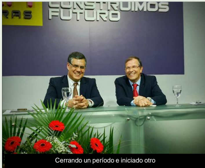
Cerrando un período e iniciado otro

Somos la primera Intendencia en contar con un protocolo para que los ingresos, respeten lo establecido en