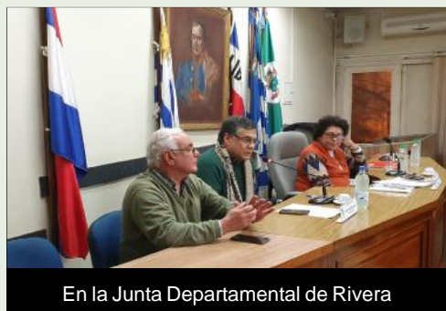
En la Junta Departamental de Rivera

Estuvimos presente en el proceso de producción de la sandía, con apoyo en equipamiento y asesoramiento, pero fue significativa la mejora en las oportunidades de comercialización, obtenidas a partir de renegociaciones con el Mercado Modelo que llevamos adelante, donde además queda abierta