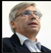
Tabaré VIERA Diputado. Fue Senador, Presidente de Antel, Director de OSE e Intendente de Rivera (2000/05-2005/10)

El País necesita terminar con el despilfarro y poner orden en las cuentas públicas, porque despilfarro es gastar mal pero también es endeudarse para demagógicamente pagar los excesos del gasto público y ni hablemos de los abusos de confianza y la corrupción, de eso habrá de ocuparse la Justicia. Astori, en apariciones de TV para justificarlo y justificar el alto déficit público, negaba el despilfarro pero admitía «algunos errores» en las estimaciones y dijo que los beneficios del crecimiento económico no había sido suficiente para financiar el aumento de los